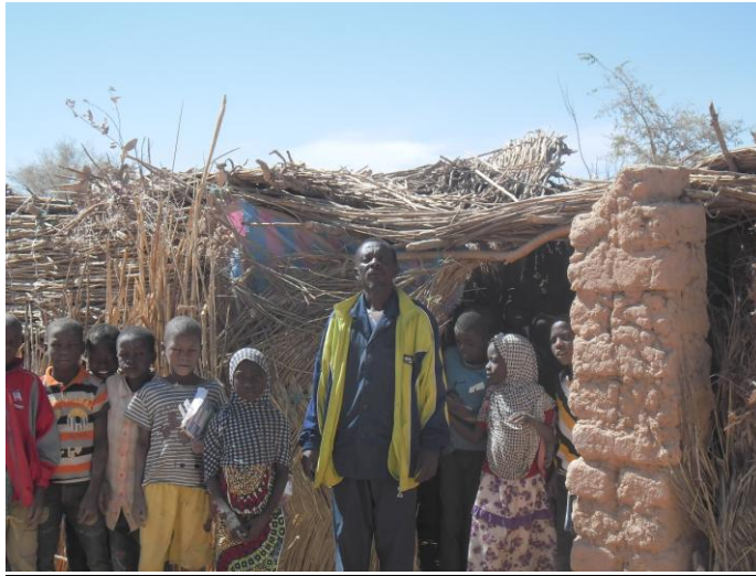
De hoofdonderwijzer voor zijn klaslokaal in Chikal

Schoolbanken : voor de school in Chikal schoolbanken zijn 89 aangeschaft (€3750)